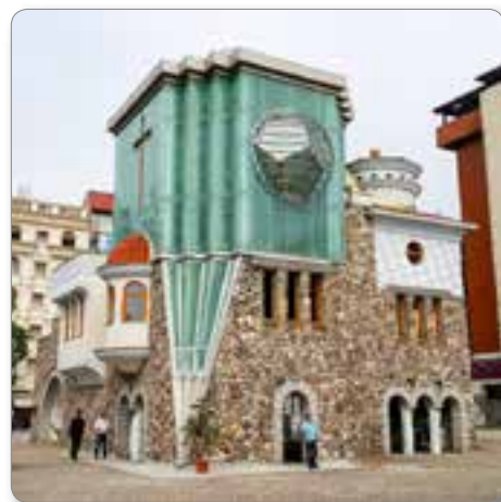
Muzej Matere Tereze.