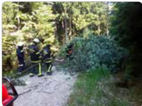
Drevje na cesti Kop – Petelinovka.

Naše operativno območje javne gasilske službe obsega celotno območje Občine Ribnica na Pohorju, z delom Zg. Janževskega Vrha, ki ga pokriva PGD Brezno – Podvelka z dogovorom.