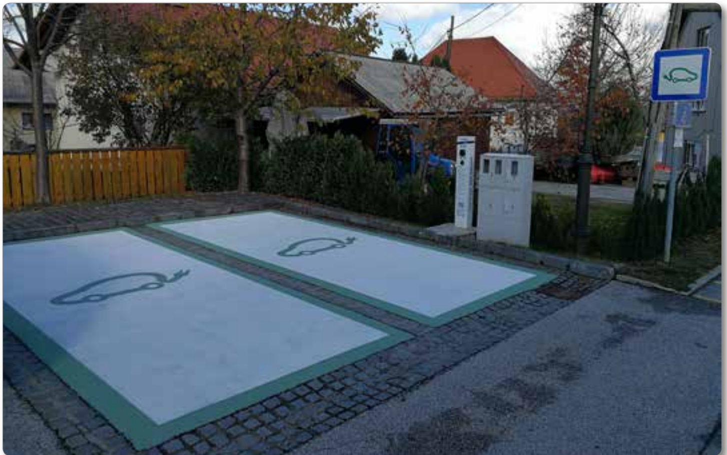
Dve polnilni mesti za električne avtomobile.

Zavedamo se, da kar naravi damo, to nam narava vrne, zato si prizadevamo spodbujati občane k ločevanju odpadkov in tako ohranjati čisto okolico v naši občini. V ta namen imamo v celotni