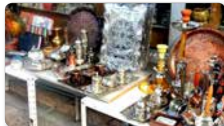
Makedonci so znani slaščičarji trgovci in proizvajalci nakita.

Po štetju prebivalcev iz leta 2016 je v Makedoniji 2 milijona 81 tisoč prebivalcev. Narodna struktura je zelo pestra in jo sestavljajo Makedonci, Albanci, Bolgari, Grki in drugi. Albanci se štejejo celo kot konstitutivni del države. Država se sicer s težavo uveljavlja v mednarodnem okolju. Sporni so ime države, zastava, grb, spomeniki in še mnoge druge stvari, simboli, ki so nujni za obeležje pokrajine, ljudi in njihove zgodovine v vsaki državi.