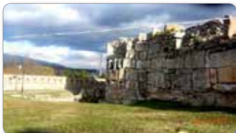
Staro mestno obzidje Kale.

Kljub času, ki je medtem pretekel, je v meni tlela neminljiva želja videti spet to deželo sonca, videti zanimive ljudi in slišati njihovo govorico.