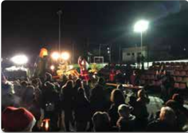
OHOHO, pa sem prišel!

„Prišla je zima, z zimo sneg in Božiček v vas ...“