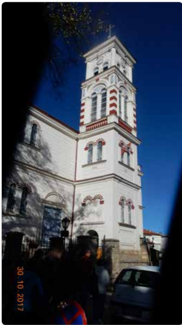
Svetišča v Kruševu.

Mati Tereza, poznana redovnica in misijonarka, je bila rojena leta 1910 albanski družini v Skopju. Leta 2016 jo je papež Frančišek razglasil za svetnico. Pojavljajo se govorice, da mati Tereza ni bila dobrotnica, temveč verski fanatik, in da se je naslajala nad trpljenjem revnih. Bila je nasprotnica kontracepcije, splava in ločitve. Njena hiša v Skopju je danes javni muzej.