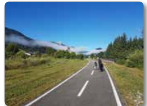
Jutro pri Trbižu.

Iz Trbiža do Gemone kolesarska pot vodi po trasi opuščene italijanske železnice Pontebana, ki nama je bila poznana, saj sva jo že prevozila. Nanjo se priključi slovenski krak iz smeri Mojstrane in Kranjske gore. Po viaduktih in tunelih mimo železniških postaj, ki so preurejene v okrepčevalnice, se zdaj podijo kolesarji, kjer je prej sopihal vlak.