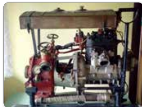
Motorna brizgalna iz leta 1928.

Gasilske vaje članic, članov in mladine potekajo po programu PGD, udeležujemo pa se tudi vaj sosednjih društev ter vaj GZDD. Na vajah