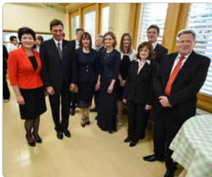
Predsednik z občinsko upravo.

Vsega, kar počne Občinski svet, njegovi odbori in komisije pa tudi občinska uprava z menoj na čelu, se seveda ne da opisati v tem uvodnem sestavku in to tudi ni moj namen. Želel sem nekako predstaviti, kaj smo počeli v preteklem letu. Ponosen sem na dosežke, tudi vseh preteklih let, odkar mi zaupate vodenje naše občine, se pa zavedam, da smo lahko še boljši. Zahvala najožjim sodelavcem, ki si prizadevajo kar najbolje opravljati svoje poslanstvo, Občinskemu svetu, ki modro odloča o strategiji občine, Nadzornemu odboru, ki bdi nad porabo sredstev in seveda vsem odboram in komisijam, ki prispevajo svoj delež k upravljanju lokalne skupnosti.