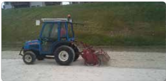
Frezanje igrišča na mivki.

Zahvaljujemo se županu in Občinskemu svetu Občine Ribnica na Pohorju za prejetu priznanje ter vsem, ki ste naš dogodek počastili s svojo prisotnostjo, in našim mladim nastopajočim. Posebna zahvala pa gre tudi vsem našim sponzorjem, ki so nam omogočili, da smo ta projekt lahko izpeljali. Takšni dogodki dajejo članom društva novo energijo. Tudi v sekciji odbojkerskega kluba so že v začetku junija postavili nove stebre in mrežo na odbojkerskem igrišču. Igranje na mivki je zelo priljubljeno, zato s sprotnim frezanjem igrišča zagotavljamo dobre pogoje za igranje. Članice te sekcije so izredno uspešne v medobčinski odbojkerski ligi, saj so sezono 2016/2017 zaključile z osvojenim 1. mestom, takšen uspeh pa se jim nasmiha tudi v sezoni 2017/2018. Z veseljem sodelujejo na turnirjih v sosednjih občinah, prav tako pa vsako leto v okviru našega občinskega praznika organizirajo turnir in dvoranski odbojki. V društvu so tudi poskrbeli za udeležbo članov na izobraževanju za sodnike odbojke.