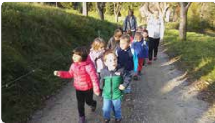
Pohod v Josipdol.

V okviru projekta Turizem in vrtec smo bili zelo aktivni. Ogledali smo si muzej na prostem v Josipdolu, v zimskem času pa smo se predajali zimskim radostim.