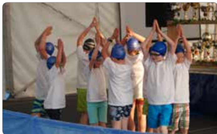
Prireditev ob 40. obletnici delovanja društva so s čudovitim nastopom popestrili učenci OŠ Ribnica.

Veseli smo, da nam je bila letos že šestič zaupana organizacija Športnega dneva Društva celiakije Slovenije, ki se je udeležijo člani društva iz cele Slovenije. Poleg tega sekcija organizira tudi več sindikalnih tekem in športnih dni. Že tradicionalen pa je tudi Veleslalom za pokal Ribnice. Ob vseh aktivnostih, ki jih izvajajo sekcije v društvu, ter ob mnogih akcijah urejanja in vzdrževanja naših športnih objektov, lahko z gotovostjo rečem, da je šport prisoten skoraj v vsaki družini.