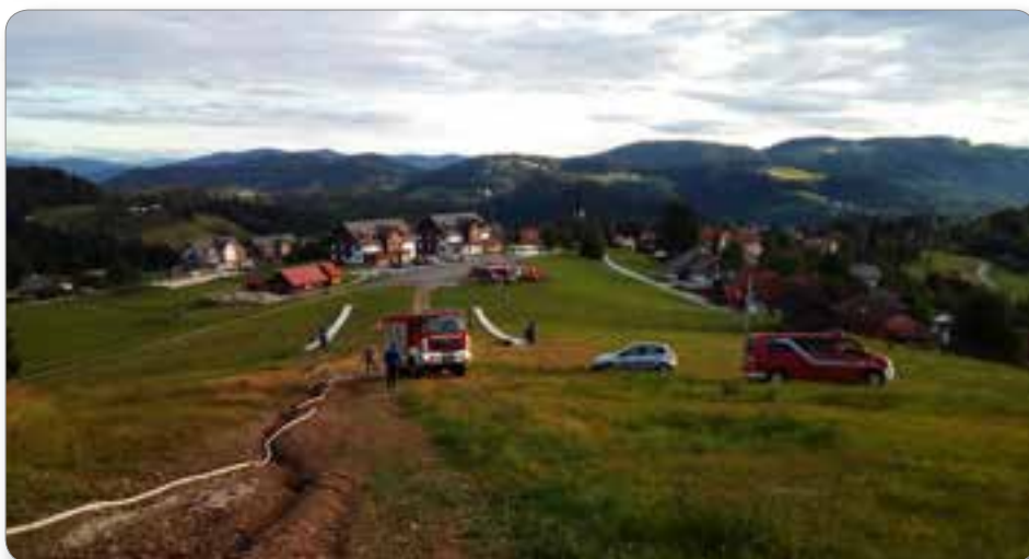
Prevoz vode v javni vodohran v Ribnici.