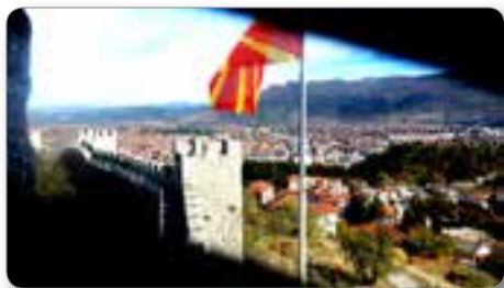
Samuelova trdnjava v Ohridu.

Vožnja skozi mestno središče Skopja je bila zelo zanimiva, nekaj posebnega. Na cestah in