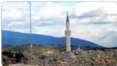
V neposredni bližini trdnjave se razprostira lep razgled na eno najlepših džamij v Makedoniji, Mustafa Pašiona džamija.

Na tržnici nisem videl osedlanih oslov in mul, natovorjenih s papriko in paradižnikom. Zamenjala so jih motorna vozila s prikolicami, mnoga v zelo slabem stanju. Tudi enotirnega vlaka »Giro«, ki je včasih veselo piskal in pihal iz mesta v druge kraje, ni bilo videti. Zamenjala so ga sodobna cestna in železniška vozila.