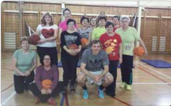
Koronarno društvo Ribnica na Pohorju.