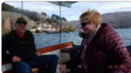
Prijatelja na ohridskem jezeru.

v nepredstavljeni gneči sem videl mnogo vrst in znank starih avtomobilov od Fiatov 1500, katrc, fičkov in drugih, starih že več kot 50 let, do modernih, sodobnih avtomobilov BMW-jev, Mercedesov ... Da so ti stari avtomobili še vedno v voznem stanju in v prometu je pravi čudež. Pogled na ta stari in novi avtomobilski park pa razkriva tudi močno razslojevanje ljudi v tej deželi. Več kot očitno se ve, kdo se vozi v enih in drugih avtomobilih.