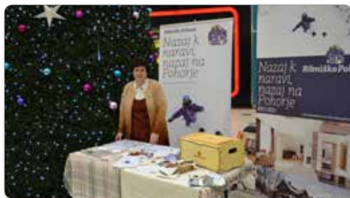
Predstavitve v EUROPARKU v Mariboru na smučarskem sejmu, november 2017.