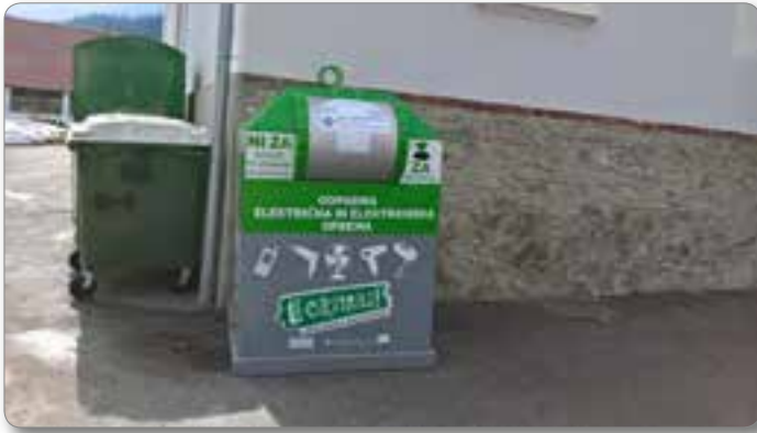
Zabojnik za odpadno električno in elektronsko opremo.

zabojnik za odpadno električno in elektronsko opremo. Ker vemo, da velik problem onesnaževanja okolja predstavljajo tudi izpušni plini iz avtomobilov, alternativa temu pa so električni avtomobili, ki so vedno bolj dostopni in priljubljeni, imamo v cen-