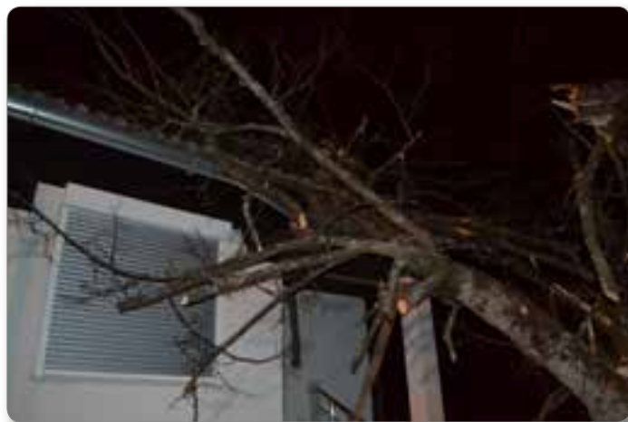
Sreča, da je drevo padlo najprej na drvarnico, kljub temu je znatna škoda na hiši.

Pa vendar imamo tudi letos kar nekaj razlogov za zadovoljstvo ob uresničevanju proračuna, jasen pogled naprej in nekaj razlogov za praznovanje. Tudi v preteklem letu smo porabili za vzdrževanje cest dobrih 107 tisoč evrov, kar je sicer nekoliko manj kot leto poprej, a že februar in marec 2018, sta bila za vzdrževalce tako zahtevna, da