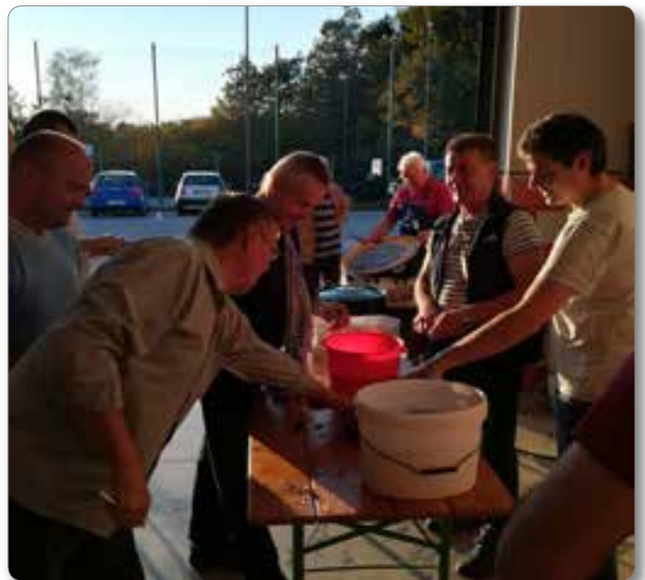
Kostanjev piknik s pevci iz Majšperka, 14.10.2017.