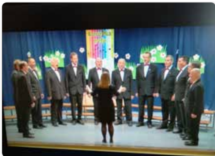
Koroška poje, 9.4.2017, Muta.

»Dragi pevci, v soboto od 18h do 21h imamo vaje. Prosim za sigurno udeležbo, ker se bliža revija in imamo veliko dela. V nedeljo ob 14h pojemo na pogrebu. Vaje bomo imeli tudi v ponedeljek od 18h do 21h.« Iz tega neuradnega SMS sporočila, ki ga pošljem pevcem je mogoče razbrati, kako aktivni smo Moški pevski zbor Ribnica. Na ta način vsak teden »nadlegujem« naše pevce. Kljub vsem svojim obveznostim se vedno odzovejo na moja sporočila in pridejo na vaje in nastope. S takšnimi pevci in prijatelji, ki jim lahko zaupam ni težko doseči ciljev, ki si jih zadamo. Veseli smo, da nam je to v celoti uspelo v lanskem letu.