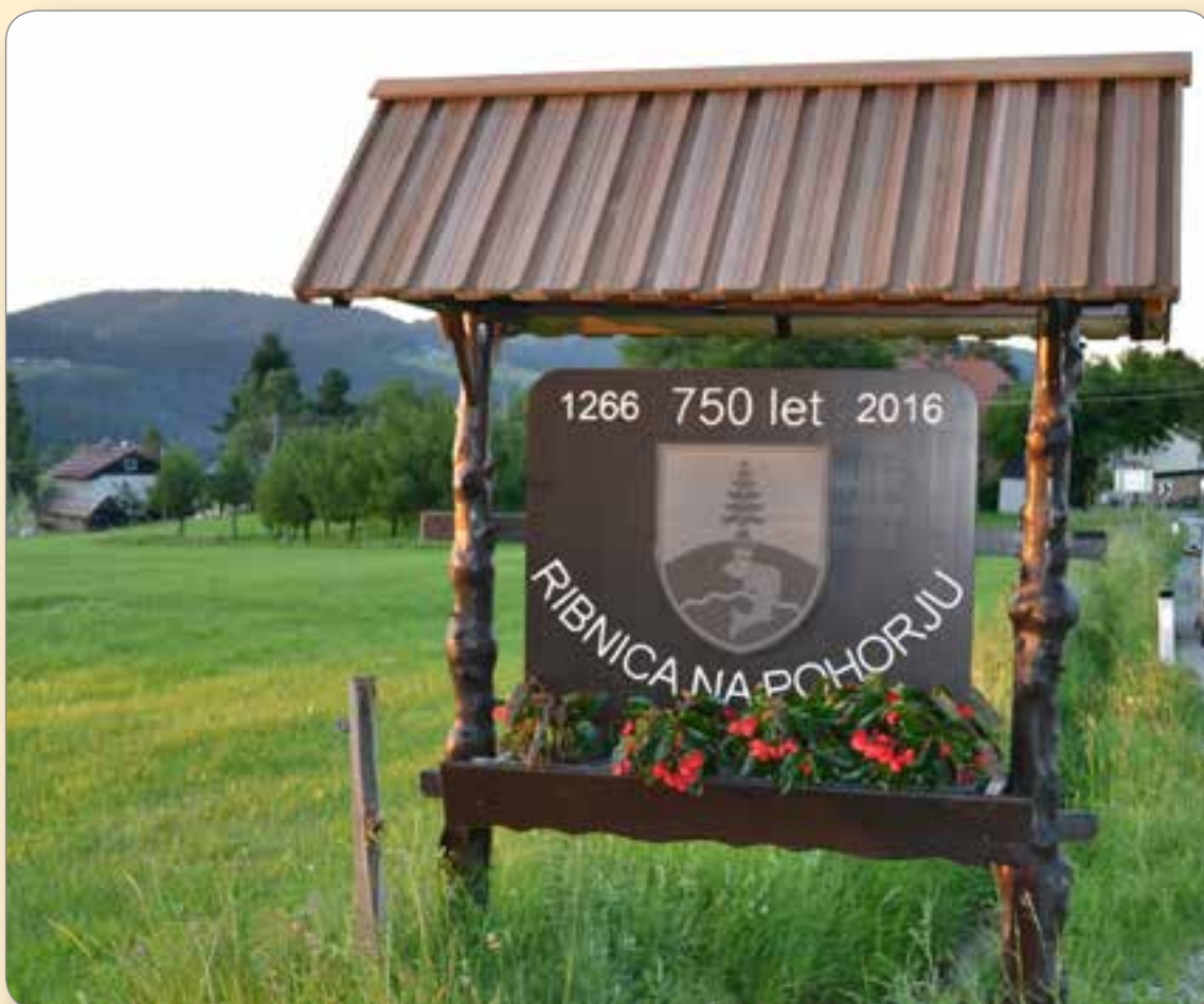
Ribnica na Pohorju.

S 50-letnim delovanjem je Turistično društvo Ribnica na Pohorju veliko prispevalo k razvoju turizma in pozitivnega utrinka življenja ljudi v kraju. Ob tem častitljivem jubileju Turistično društvo Ribnica na Pohorju prejme Priznanje Občine Ribnica na Pohorju.