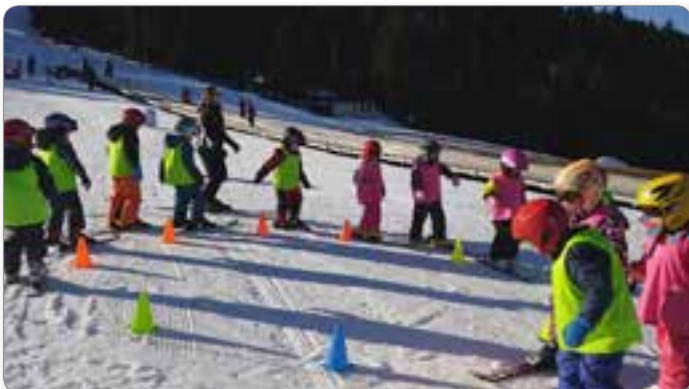
Ogrevanje pred smučanjem.

Toplo jesensko dopoldne smo izkoristili za pohod v Josipdol. Najprej