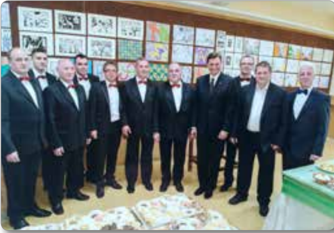
Slavnostna seja občinskega sveta s predsednikom RS Borutom Pahorjem, 18.5.2017.