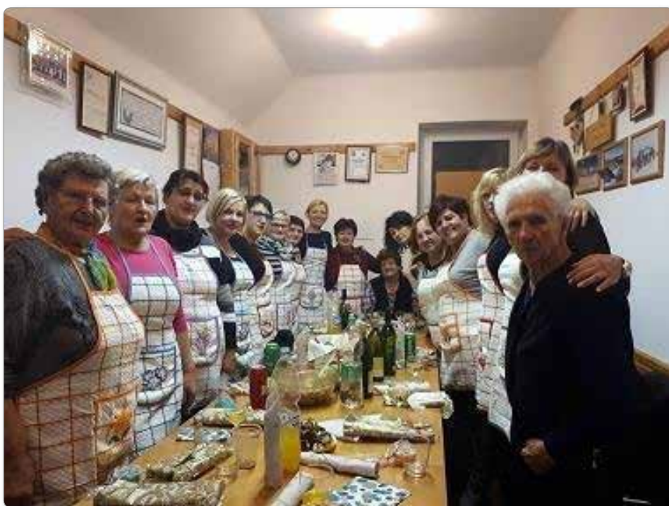
Srečanje ob zaključku leta 2017.