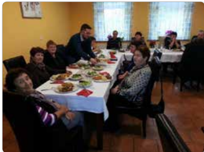
Zaključek koledarskega leta.

“Bodimo dobri ljudje. Dober človek je kot hoja po pesku. Ne sliši se korakov, ampak sledi ostanejo...” (Sean Connery)