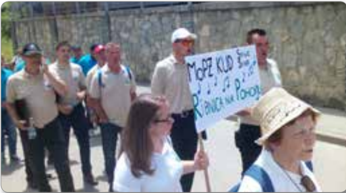
48. Tabor pevskih zborov, Šentvid pri Stični, 18.6.2017.