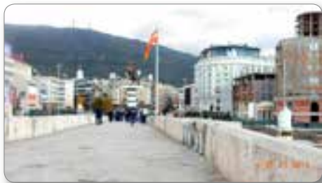
Dušanov kamniti most.

Makedonci svoj denar imenujejo kar „makedonski denar“. Njegova menjalna vrednost je 60 denarjev za 1 evro.