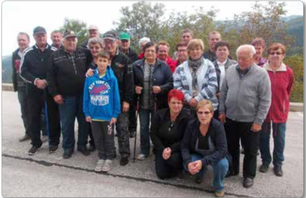
Pohod k teti Leni.

Pet članov MDI Drava Radlje ob Dravi, OO DI Ribnica-Josipdol, se je povežalo v skupino ljudskih pevcev. Nadeli so si ime RIBNIŠKI FANTJE, čeprav njihova povprečna starost ni ravno fantovska. Pravijo, da kdor