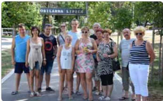
Druženje dramske skupine po nastupu v Kopru na letnem odru, 2.8.2017.

Za društvom je 131 spoštovanja vrednih let, za mano pa že 10 let vodenja dramske skupine. To je že neka doba v kateri se je izmenjalo nekaj ljudi velikega srca, ki imamo radi prostovoljno delo in svoj prosti čas namenjamo kulturi in se odrekamo marsikdaj tudi kaki družinski ali prijateljski obveznosti. V vseh teh letih smo se naučili 7 komedij, osmo končujemo in jo bomo postavili na oder v aprilu, torej smo naštudirali skoraj vsako leto eno. Lani smo se naučili enodejanko Štiriperesna deteljica. V vseh teh letih smo stali na odru kar 111 x. Če si to preračunamo, lahko rečemo, da smo tretjino leta bili odsotni od doma, od svojih najdražjih. Če pa prištejemo še vaje, katerih je najmanj 40 za eno predstavo, je to res pohvale vreden čas, ki ga žrtvuujemo, da lahko ohranjamo kulturne užitke doma in po celi Sloveniji. Vse komedije imamo tudi posnete na DVD-jih in prav tako smo si s pomočjo razpisov