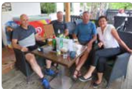
Vpis v knjigo K24.

Ob 4.30 uri smo prispeli na Kočo na Peci. Že od daleč smo opazili, da v koči gori luč, kar je pomenilo, da nam je oskrbnik pripravil zajtrk, kakor smo se predhodno dogovorili.