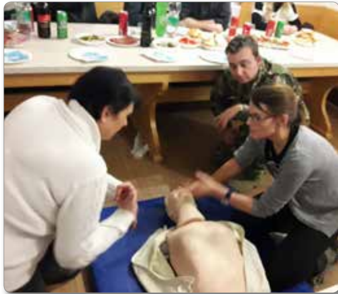
Praktični del usposabljanja na vadbeni lutki.