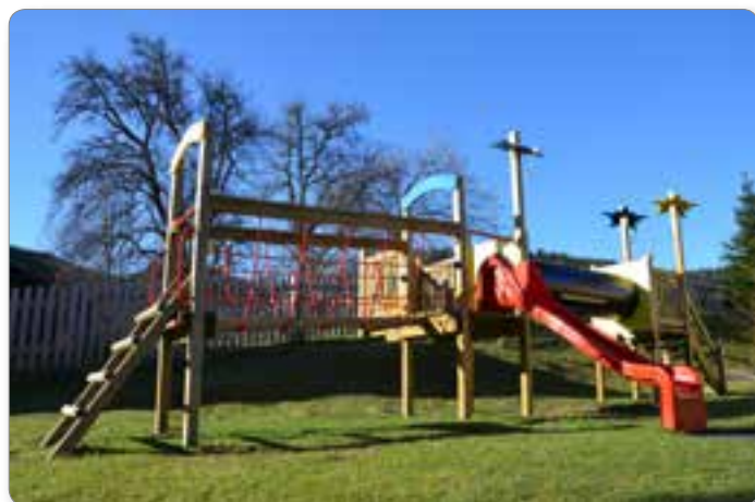
Nova igrala za najmlajše.

kar precejšnja sredstva. V obravnavanem obdobju smo za pomoč na domu, domski oskrbi, subvencijam stanarin, zdravstvenem zavarovanju brezposelnih oseb in podobno namenili dobrih 111 tisoč evrov. Ob tem se iskreno zahvaljujem tudi vsem, ki se s to tematiko prostovoljno ukvarjajo v Rdečem križu, Škofjski Karitas in društvih, saj je razumevanje in pomoč sočloveku del naše bogate kulture. Zagotovilo za dober in kakovosten razvoj lokalne skupnosti pa je zagotovo izobraževanje. V Občinskem svetu in upravi občine se tega še posebej zavedamo. Otroškemu vrtcu smo namenili 122 tisoč evrov, osnovni šoli pa dobrih 90 tisoč evrov. V šoli smo z menjavo 15. vrat poskrbeli za naravno