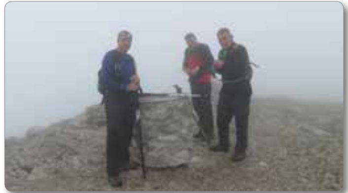
Na vrhu Pece.