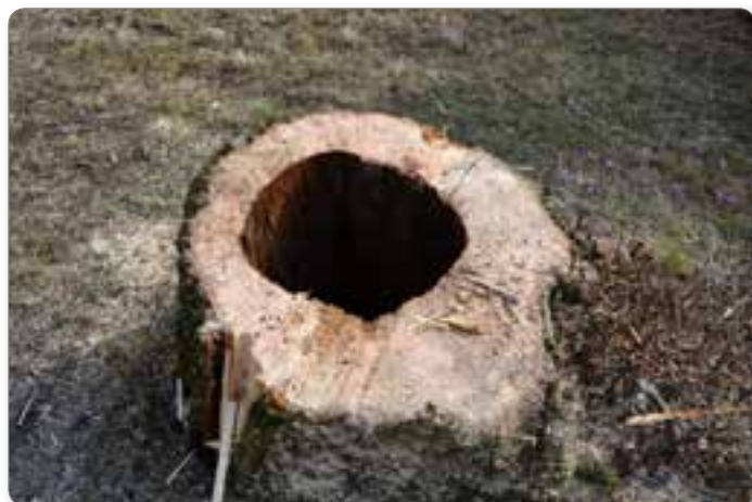
Kdaj bi se podrla sama od sebe tale lipa?