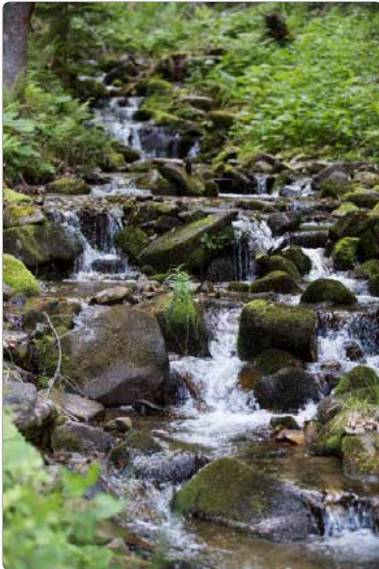
Potok na Ribniškem Pohorju s kristalno čisto vodo.

na Pohorje« – nagovarja vse, ki se želijo umakniti mestnemu vrvežu in monotonemu vsakdanu ter preživeti kakovosten oddih v naravi, v neposrednem stiku s tradicijo.