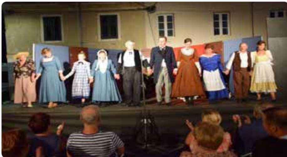
Nastop na letnem odru v Kopru, 1.8.2017.