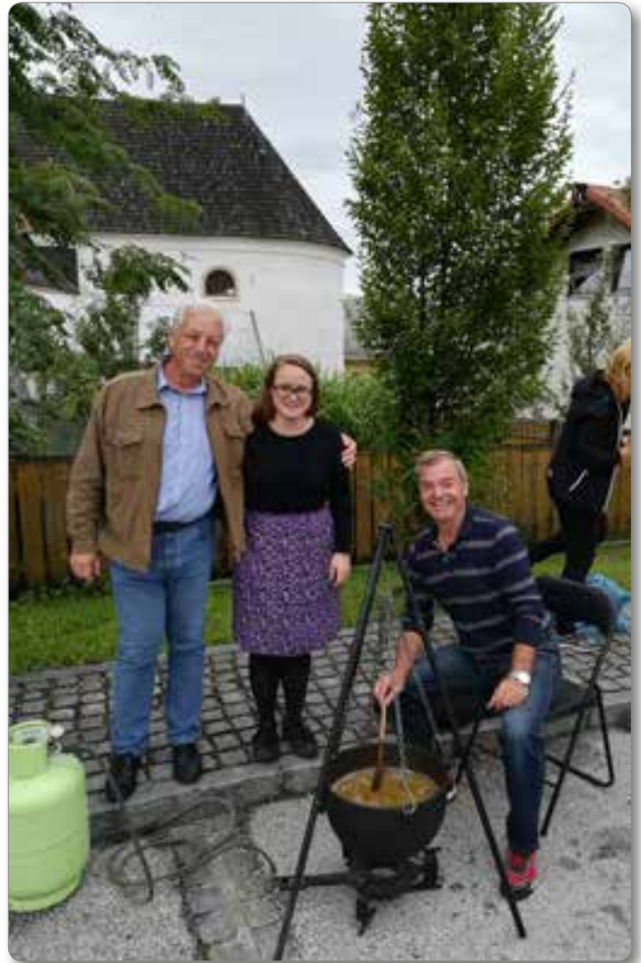
Kuhanje Jernejeve župe, 20.8.2017.