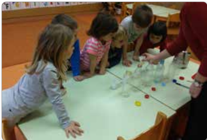
Eksperiment z vodo.

Rdeča nit našega oddelka so štirje elementi: zrak, voda, zemlja in ogenj. Elemente spoznavamo preko junakov iz revije Modri Jan, in sicer Modri Jan predstavlja vodo, Puhec zrak, Packa Rija predstavlja zemljo in Sončnica ogenj. V oddelku se o elementih veliko pogovarjamo, jih spoznavamo v naravi skozi štiri letne čase, preko pesmic, deklamacij, v okviru tematike ustvarjamo ter izvajamo različne eksperimente.