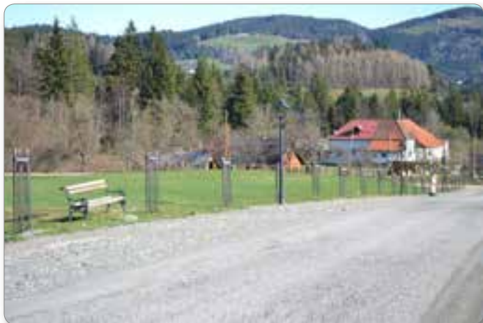
Nov drevored z lučmi in klopami, letos pa še nov asfalt na cesti in sprehajalni poti.

bomo morali ponovno pretehtati, ali smo letos cestam namenili dovolj denarja.