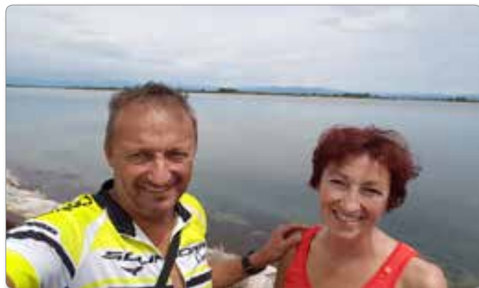
Selfi v Gradežu.