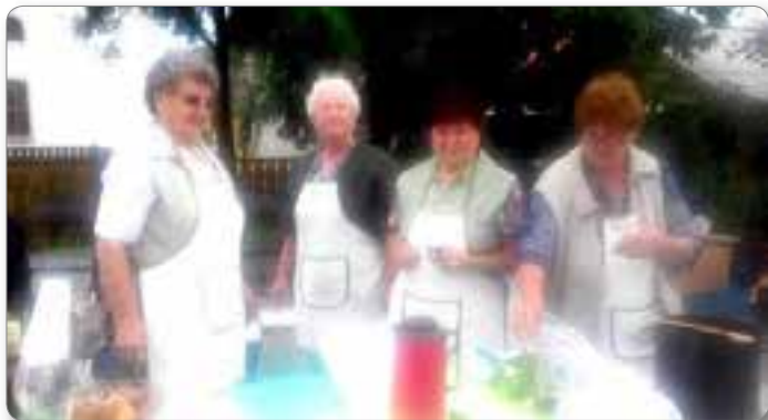
Kuhanje jernejeve župe.

Kot ročnodelsko društvo Pohorska zarja smo poznane po naših izdelkih in razstavah v okviru naše občine, pa tudi marsikje na Koroškem in Štajerskem, saj so naši izdelki unikatni, estetski in uporabni. So delo pridnih rok in izvirnih idej naših članic. Ker vztrajamo že drugo desetletje, smo v tem času izgubile že prenekatero članico, vendar se nam vsako leto pridružijo nove in zato lahko vztrajamo že vrsto let. Morda je naše društvo zanimivo tudi zaradi tega, ker se ne drži samo strogega ročnodelskega ustvarjanja, ampak se članice družimo tudi izven naše osnovne dejavnosti.