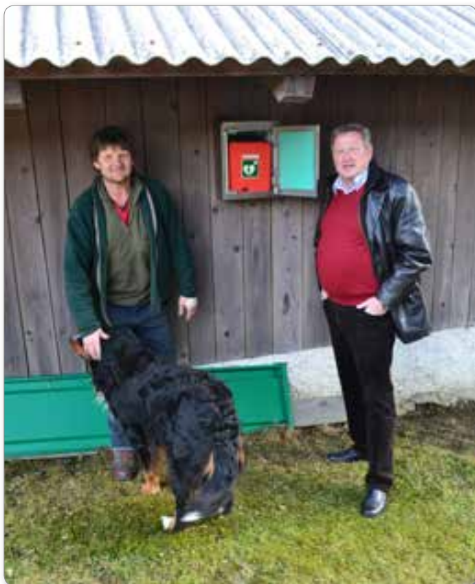
Domačija Stepišnik, na območju občine smo namestili 3 nove AED aparate.

svetlobo nad vrati tako, da so hodniki svetli tudi brez umetne svetlobe, tudi sicer pa so bila vrata potrebna zamenjave. Z novimi igrali pa smo najmlajšim uporabnikom omogočili varno igranje na prostem. Šola ima v lokalni skupnosti poseben pomen. Tudi tukaj bi rad izrazil spoštovanje do učiteljic in učiteljev, ki naše otroke vzgajajo za življenje in dosednji uspehi učencev na vseh stopnjah izobraževanja in prostovoljnih aktivnosti to dokazujejo. Čutim se dolžnega izreči posebno pohvalo tudi gospodu ravnatelju za učinkovito vodenje ustanove.