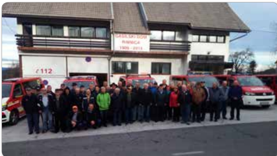
Gasilsko srečanje veteranov v Ribnici in Josipdolu.

se izpopolnjujemo in izobražujemo, dobrodošle so tudi za spoznavanje novega orodja in opreme, saj se gasilska oprema nenehno obnavlja in posodablja. V mesecu požarne varnosti v oktobru smo izvedli vajo „VERIŽENJE“. Z motorno brizgalno smo črpali vodo iz potoka Velka pri Klemenčiču in jo po tlačnih