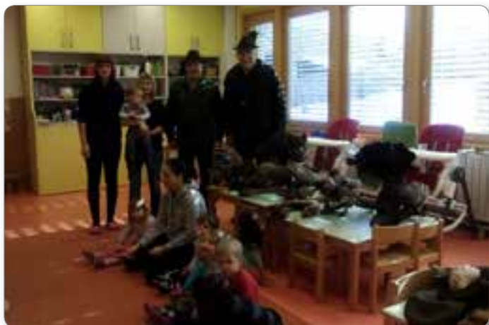
Skupaj smo stopili in fotko naredili.

„Po gozdu lovec s puško hodi, ko krasno jutro se rodi. Po suhem listju varno hodi, toda živali ne zasledi ...“