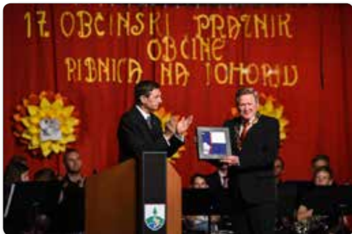
Obisk predsednika države Boruta Pahorja na naši slavnostni seji.

Leto hitro mine in vesel sem, da lahko spet napišem uvodne misli k letošnji izdaji Ribniških novic. Menim, da smo tudi preteklo leto delali dobro, da smo uresničili velik ali pretežni del načrtovanega, poleg tega pa znali prisluhniti vsakodnevnim težavam občanov in občanov in jih sproti tudi reševati.