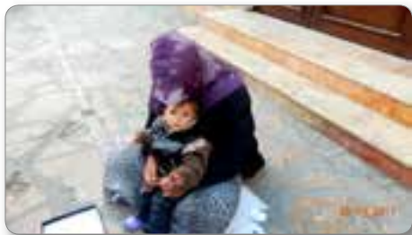
Ženska z otrokom na ulici Skopja.

V državi vlada velika revščina. Ocenjuje se, da je revnih skoraj polovica prebivalcev.