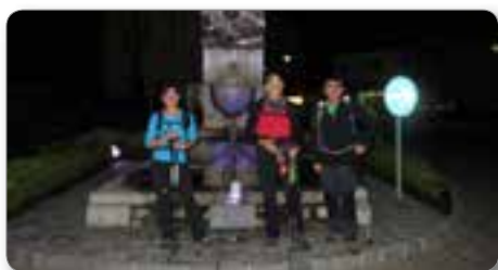
Spomenik v Črni na Koroškem.

Vremenska napoved za petek ni bila najboljša, napovedane so bile popoldanske plohe, za soboto pa je bilo napovedano lepo vreme. In tokrat se vremenarji niso zmotili. Dan je hitro minil in že se je bližala ura odhoda. Naša trasa je potekala takole: štart pri Andrejevem domu na Slemenu–Uršlja Gora–Naravske Ledine–Žerjav–Črna–Peca–Kumer–Olševo–Bukovnikovo sedlo–Raduha–Koča na Loki–Veliki Travnik–Komen–Smrekovec in cilj Dom na Slemenu.