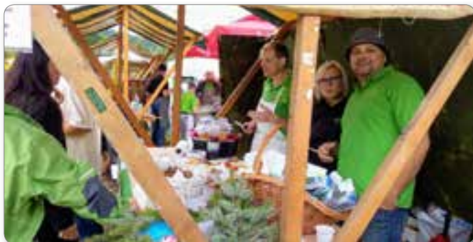
Pa začnimo restat krompir! V Velenju, september 2017.

Med številnimi dejavnostmi in prireditvami naj letos izpostavimo Jernejevo nedeljo. Sv. Jernej, po katerem se imenuje župnijska cerkev sredi vasi, goduje 24. avgusta, lepa nedelja pa je v nedeljo pred ali po godu.