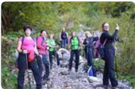
Na začetku poti - Lepena.

Ob pričetku nove sezone pa smo se članice Zumba skupine odločile za malo drugačno obliko aktivnosti. Odpravile smo se na severno Primorsko. Naš cilj je bil druženje, pohodništvo in ogled naravnih znamenitosti. V muhastem septembru smo si na srečo izbrale zadnji vikend, ki je bil edini zares sončen in topel. V petek smo se v zgodnjih popoldan-