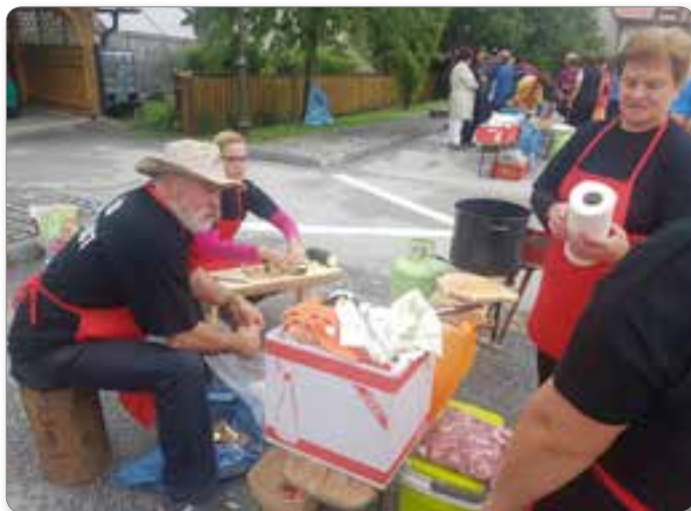
Ekipa ŠD HUDI KOT v kuhanju »Jernejeve župe«.

Ribnica na Pohorju udeležili kuhanja »Jernejeve župe«.