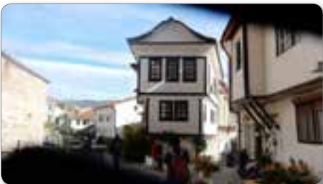
Tipična mestna hiša v Ohridu.

Smer vožnje in cilj našega obiska je bilo središče mesta oz. staro mestno obzidje Kale, ki je še vedno v fazi odkopavanja in rekonstrukcije. Obzidje se razteza visoko nad mestom in nudi obiskovalcem dober razgled nad mestom, na nogometni stadion in okoliške planine.