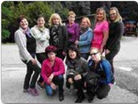
Slavo od doma.

V poletnih mesecih si članice skupine Zumba Josipdol vzamemo prosto, saj se takrat praktično zaprejo vrata dvoranskih športov. Čez poletje vadba Zumbe poteka samo na ploščadi pri dvorcu Bukovje v Dravogradu, kjer se posamezno pridružimo dravograjski skupini, da čez poletje povsem ne pozabimo starih in se naučimo nekaj novih koreografij.