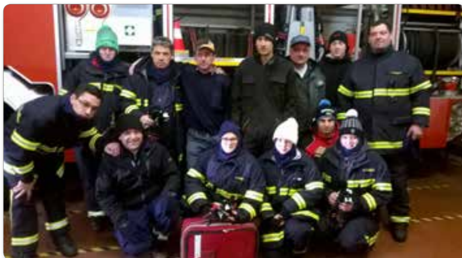
Udeleženci uspešne iskalne akcije na območju Hudega Kota in Ribniške koče.

Izvozi na razne intervencije potekajo v skladu z normami, ki jih moramo doseči, to je po pozivu izvoziti v štirih minutah s prvim vozilom. Vozila in posadke so različni glede na vrsto intervencije in kraj. Potrebno število gasilcev na tipičnih požarnih intervencijah določi vodja intervencije, ki tudi določi, katero vozilo izvozi prvo.