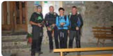
Andrejev dom na Slemenu.

K24 je najtežji koroški hribovski izziv. Pohodnik mora v manj kot 24-ih urah prehoditi pet najvišjih koroških vrhov, in sicer Uršljo goro, Smrekovec, Raduho, Olševo in Peco. Pot je dolga okoli 90 km, premagati pa je potrebno 5300 m vzpona in spusta.