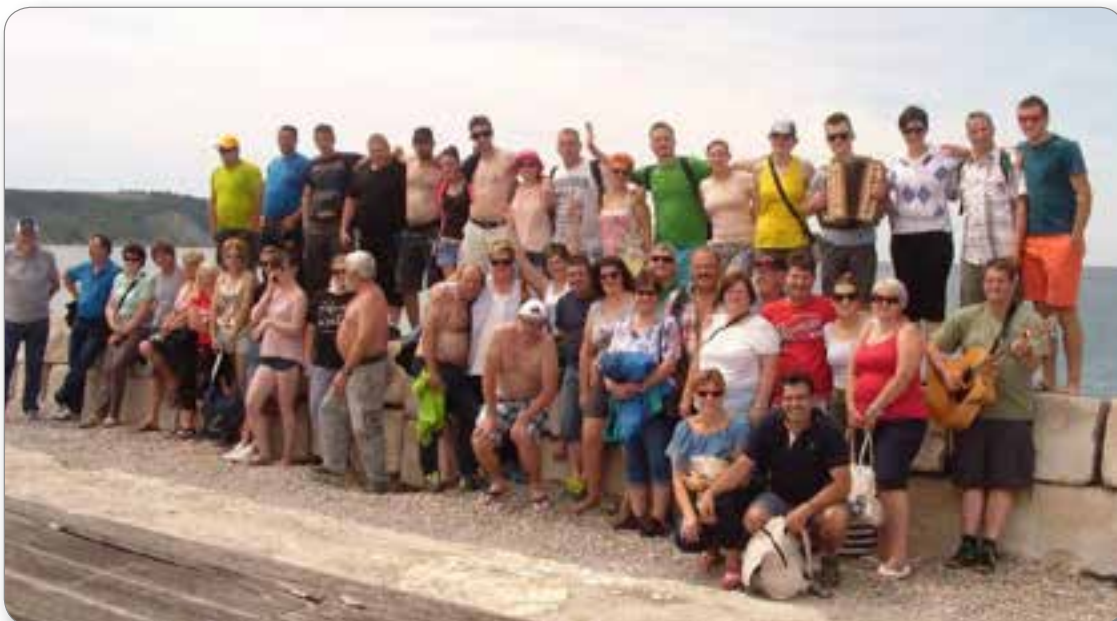
Izlet ŠD HUDI KOT na morje 2017.

Konec avgusta, ko goduje patron naše farne cerkve v Ribnici, Sv. Jernej, smo se na pobudo Turističnega društva