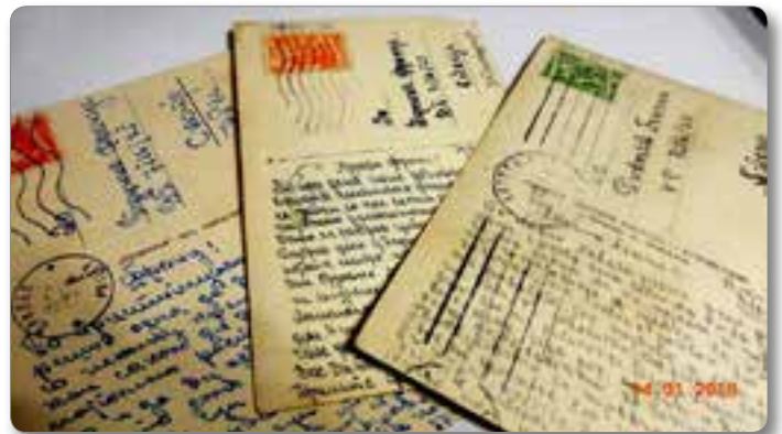
Dopisnice z naslovi in tekstem.