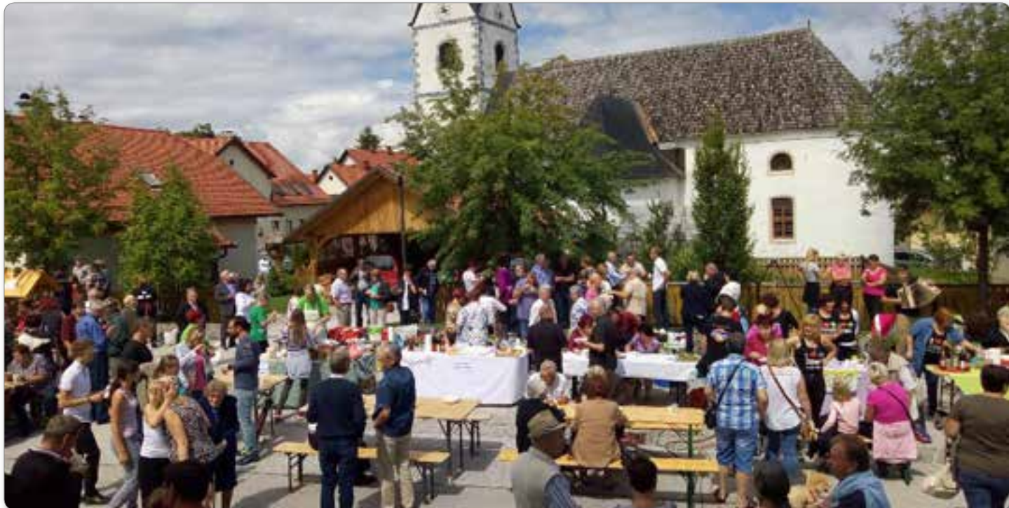
Jernejeva nedelja, avgust 2017.