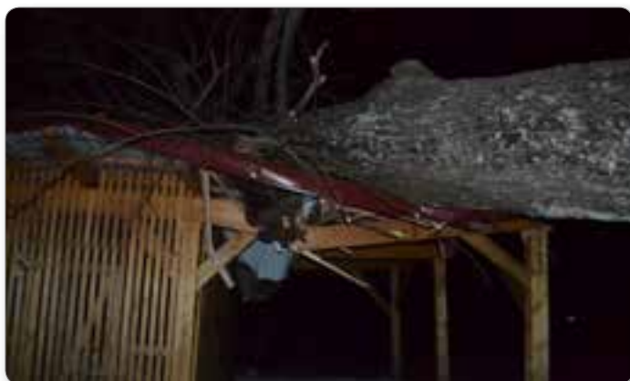
Drvarnica je preprečila večjo škodo in morebitne žrtve.