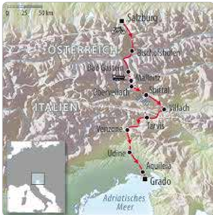
Trasa kolesarske poti.

navigacijo na telefonu sva končno našla hotel in ko sva kolesi parkirala v hotelski depo, je že deževalo. Naslednje jutro sva si ogledala stari del mesta, nato pa krenila proti Palmanovi. Mesto, ki je znana »shopping« destinacija, ima ogromen okrogel trg z obeliskom na sredini. Do morja je manjkalo le še 30 km, zato sva močneje pritisnila na pedale in kmalu se je začutil vonj po morju. Še nekaj blagih vzpetin in pred nama se je razširilo morje. Prispela sva na cilj v Gradež. Še obvezen »selfie« za konec poti ALPE-ADRIA. Števec je kazal 407 km. S tem pa najine poti še ni bilo konec. Gradež nima železniške povezave, zato sva kolesarila naprej do Devina, kjer sva prenočila in se naslednji