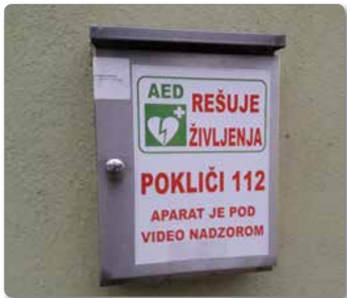
AED, nameščen na večnamenskem prostoru v Hudem Kotu.

Spomladi 2017 se je porodila ideja, da se dodatno kupi eksterni defibrilator za zaselek Hudi Kot – relacija Gregl–Repišnik. Občinska svet-