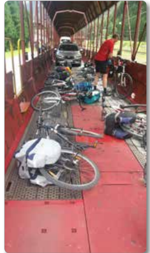
Kolesa na vlak.

Zbudilo naju je deževno jutro in po romantičnem zajtrku v zimskem vrtu, na katerega so padale težke kaplje, sva si nadela pelerine in sedla na kolo. Kolesarska pot tod vodi ob Dravi večino po makadamskih poteh. V mestu Villach sva zavila čez Dravo in krenila zahodno proti italijanski meji. V kraju Arnoldstein je prenehalo deževati. Kolesi in oblačila so bili blatni, zato sva opremo sprala v bližnji avtopralnici. Popoldne sva prispela do italijanske meje in mesta Trbiž. Načrtovala sva postanek le za kosilo, ker pa je začelo deževati, sva v Trbižu prenočila. Jutranje nebo je bilo turkizne barve, športniki rečemo »špegel«, dežne muke