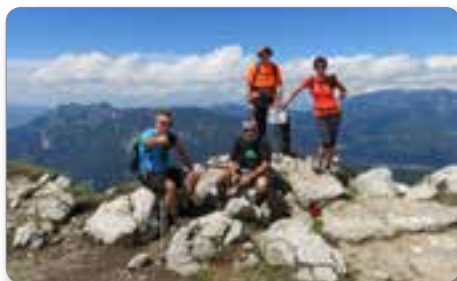
Na vrhu Raduhe.

Na koči smo se zadržali le kratek čas, toliko da smo pozdravili oskrbnico, ki nam je zaželela srečno pot, in že smo hiteli proti Žerjavu.