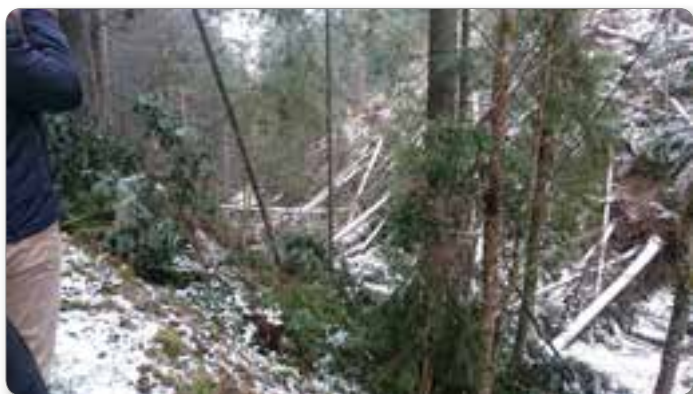
Veter nam je v pozni jeseni povzročil nemalo preglavic. Cesto Greglov jarek - Zgerm smo sanirali uspešno.

Menim, da smo na pravi poti, ker varovanju okolja posvečamo tako posebno pozornost. V proračunu smo predvideli tudi pomoč vsem, ki bodo gradili male čistilne naprave, ker ne spadajo v območja aglomeracije, oziroma spadajo v tista območja, kjer se ne bo gradilo večjih čistilnih naprav.