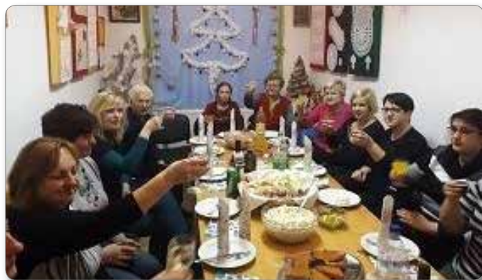
Praznovanje rojstnega dne.

Tako se nam je lani v avgustu v nepozaben spomin zapisalo sodelovanje pri kuhanju »Jernejeve župe«. Čeprav vreme nosilcu prireditve – Turističnemu društvu Ribnica – ni šlo na roko, pa sta obisk in zadovoljstvo udeležencev pokazala, da je bila zamisel izvrstna. Ko so nas povabili k sodelovanju, smo takoj »zagrabile« in pričele snovati ideje, kako skuhati najboljšo župo. Izbirale smo sestavine, pobrskale po spominu, kaj vse so v župo dale naše mame, da je bila tako slastna, usklajevale okuse in se po spletu idej in uskladitev dogovorile, kakšna bo naša župa. Kot prekaljene kuharice smo si na dan dogodka nadele predpasnike, nabrusile nože, pripravile posodo, kuhlalnice in potre-