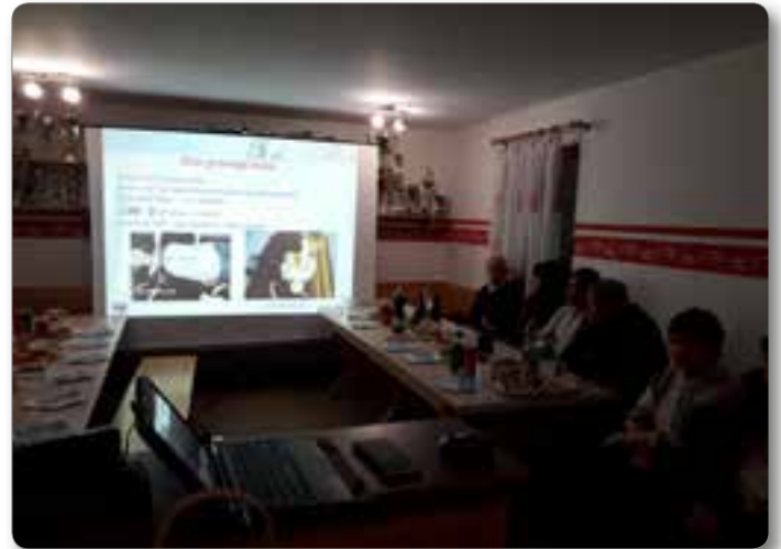
Teoretični del usposabljanja.

Predavanje so izvedli pripadniki Role2-LM ter krajane teoretično in praktično poučili o temeljnih postopkih oživljanja in o ravnanju z