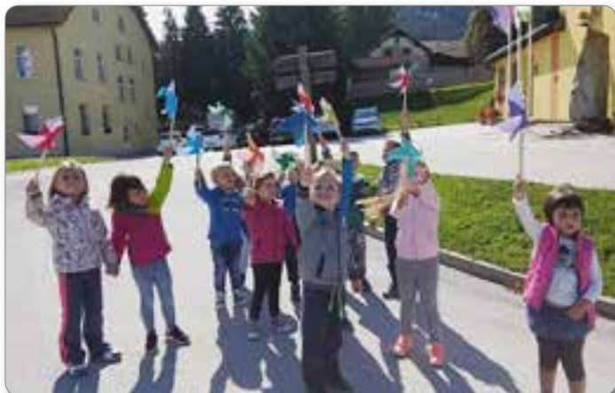
Igra z vetrnicami.