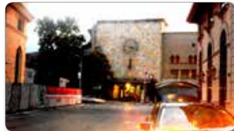
Nekdanja železniška postaja.

Makedonija je najbolj južna dežela nekdanje skupne države Jugoslavije.