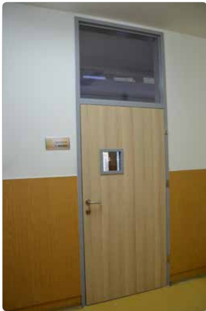
Nova vrata v osnovni šoli.

Nadaljujemo tudi z obnovo pokopališča, stopnice do sanitarij smo naredili, obložili jih bomo z granitom, čaka pa nas obnova drevoreda, za kar smo že pridobili predračun ustreznega strokovnega podjetja. Socialni varnosti zmeraj posvečamo veliko pozornost in namenjamo