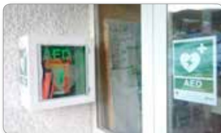
AED nameščen na gasilskem domu v Ribnici.

V letu 2015 smo se pridružili Prvim posredovalcem ob pomoči pri srčnem zastoju z upora-