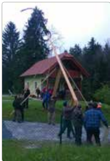
Postavitev majskega drevesa Hudi Kot 2017.

Nobeno leto ne izpustimo oglada smučarskih poletov v Planici, zato smo se s polnim avtobusom odpeljali v dolino pod Ponce in uživali ob uspehu naših skakalcev.