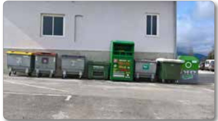
Zabojniki za ločeno zbiranje odpadkov z zabojnikom za tekstil, čevlje in igrače pri Vili Vicman.

zabojnik za odpadno električno in elektronsko opremo. Ker vemo, da velik problem onesnaževanja okolja predstavljajo tudi izpušni plini iz avtomobilov, alternativa temu pa so električni avtomobili, ki so vedno bolj dostopni in priljubljeni, imamo v cen-