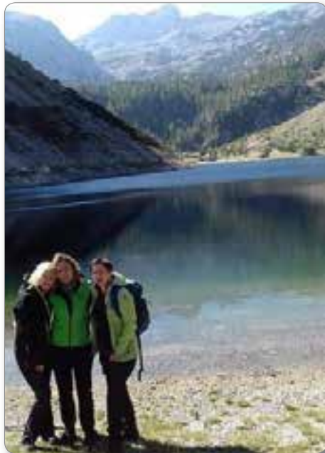
Ob Krnskem jezeru, v ozadju Krn.

skih urah v Josipdolu naložile s kupom prtljage v dva avtomobila in se odpeljale proti mejnemu prehodu Vič.