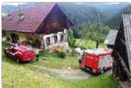
Prevoz vode Hudi Kot.