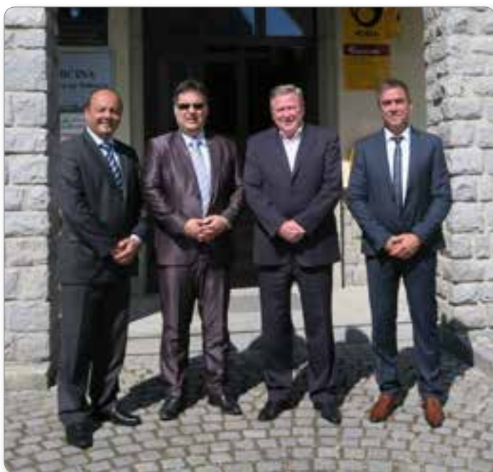
Obiskala nas je tudi delegacija Državnega sveta s predsednikom Mitjem Brvarjem na čelu.

svetlobo nad vrati tako, da so hodniki svetli tudi brez umetne svetlobe, tudi sicer pa so bila vrata potrebna zamenjave. Z novimi igrali pa smo najmlajšim uporabnikom omogočili varno igranje na prostem. Šola ima v lokalni skupnosti poseben pomen. Tudi tukaj bi rad izrazil spoštovanje do učiteljic in učiteljev, ki naše otroke vzgajajo za življenje in dosednji uspehi učencev na vseh stopnjah izobraževanja in prostovoljnih aktivnosti to dokazujejo. Čutim se dolžnega izreči posebno pohvalo tudi gospodu ravnatelju za učinkovito vodenje ustanove.