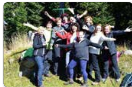
Bilo je nepozabno.

Z lepimi vtisi in srečne, da smo naredile nekaj zase, smo se vrnile v domače okolje.