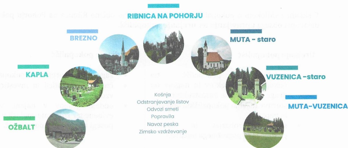
Slika 1 Pokopališča v upravljanju in vzdrževanju družbe

Glavnina aktivnosti v pokopališki dejavnosti bo obsegala redno vzdrževanje funkcionalnih in skupnih pokopaliških površin ter redno vzdrževanje sakralnih objektov na pokopališčih. Strošek rednega vzdrževanja pokopališč se bo tudi v letu 2026 pokrival iz grobnin.